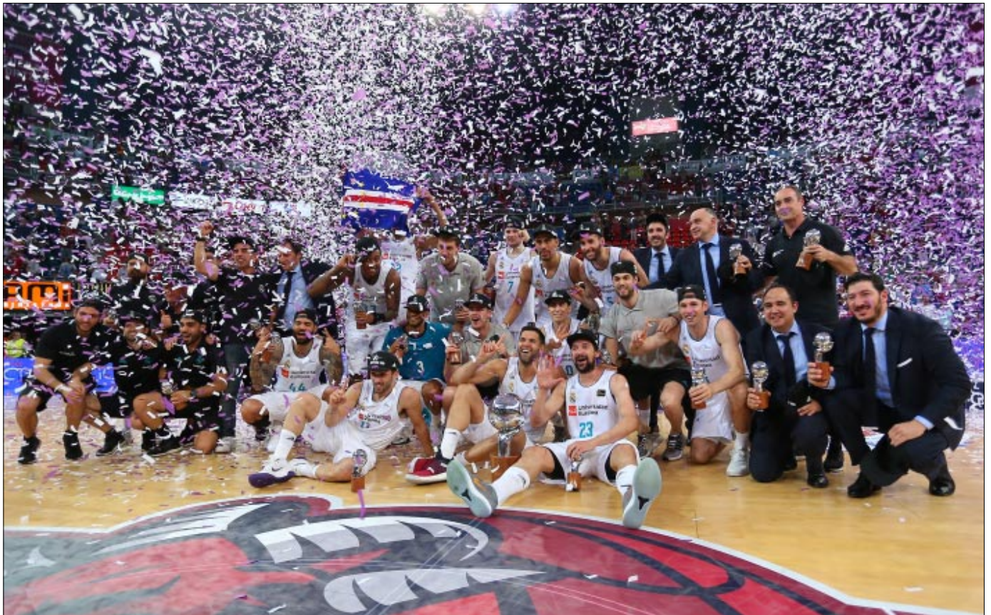
Real Madrid, campeón de la Liga Endesa 2017-2018