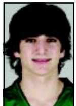
Ricky RUBIO (DKV Joventut)