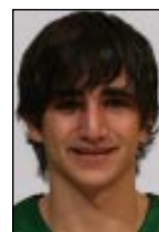
Ricky RUBIO (DKV Joventut)