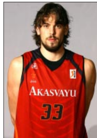
Marc GASOL (Akasvayu Girona)