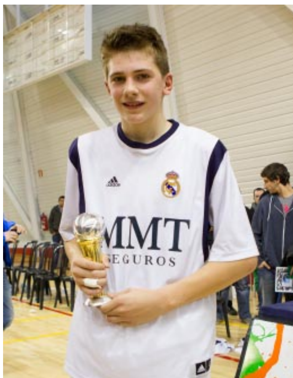
Luka Doncic con el trofeo de MVP de la Minicopa